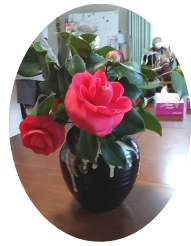
ふじみ苑の庭に咲いた椿

【住所】 〒670-0053 姫路市南車崎 2丁目1-12-208 【電話】 079-297-2725 【FAX】 079-297-6695