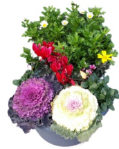
ふじみ苑玄関前の『寄せ植え』

[住所] 〒670-0053 姫路市南車崎 2丁目1-12-208 [電話] 079-297-2725 [FAX] 079-297-6695