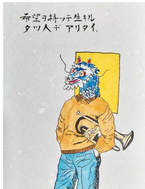
猪塚祐孝さん作 (2000年作成)