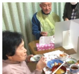
★ 七草がゆ ★