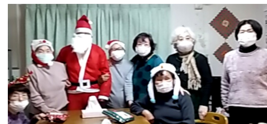
★ クリスマス会 ★

クリスマス会で は芸達者なスタッ フが、自前のギ ターで生演奏。 参加者からのリ クエストにも応 えました。「久 しぶりに歌えて うれしかった」