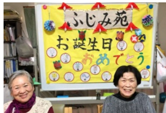
★ 誕生会 ★

組合・同好会に関する お問い合わせや申し込みは、079-297-2725 (姫路支部) まで