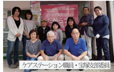
ケアステーション職員・宝塚支部委員